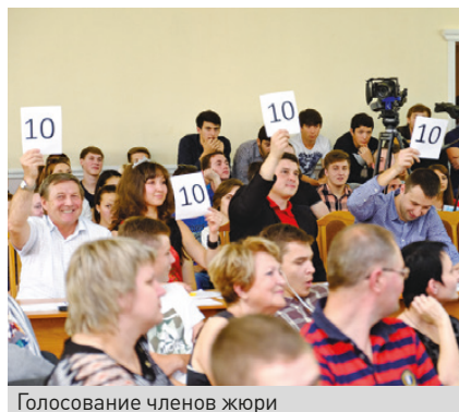
Голосование членов жюри