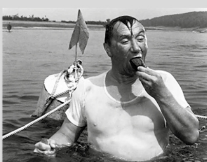
Кадры из фильма «Добро пожаловать, или Посторонним вход воспрещён»

Проектирование заняло ровно неделю. После обсуждений я внёс необходимые поправки, а затем передал чертежи в производство.