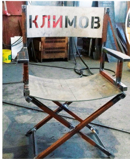
Цех. Изготовление конструкций для памятного знака