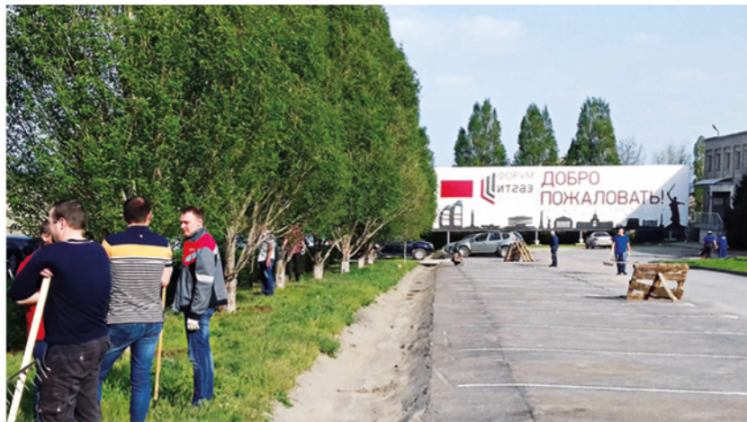
Параллельно с уборкой территории была обновлена дорожная разметка на парковке