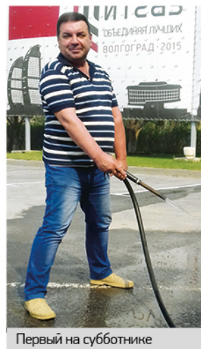
Первый на субботнике