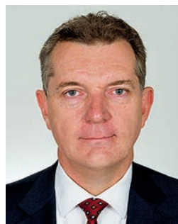
Петер Теш, посол Австралии в РФ

2 февраля город-герой Волгоград торжественно отметил 75-ю годовщину разгрома советскими войсками немецко-фашистских захватчиков в Сталинградской битве.