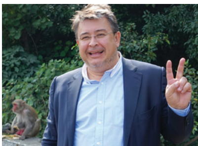
С символом наступающего года

Поздравляю вас с наступающим Новым 2016 годом!