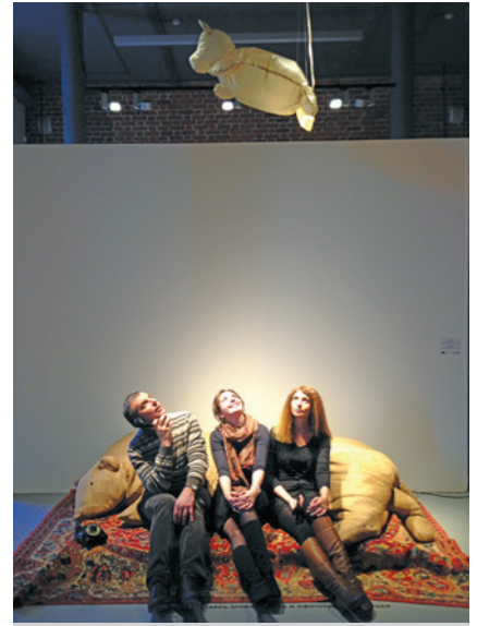
На выставке современного искусства в «Арсенале»*