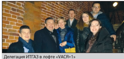
Делегация ИТГАЗ в лофте «ВАСЯ+1»

Отдельно хочется сказать про лофт «ВАСЯ+1» – проект, посвященный знаменитому ученому, реформатору речного флота Василию Ивановичу Калашникову, чьи гениальные идеи рождались в стенах данного здания. Сейчас в атмосферу особняка 19 века интегрированы современные технические решения и футуристические объекты, создающие неповторимое идеальное место для комфортного отдыха и творчества. 🌲