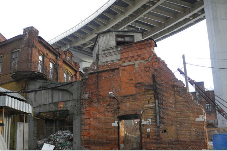
Старинное здание, находящееся прямо под мостом метрополитена через реку Оку