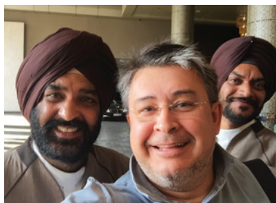
С сикхами в Бомбее