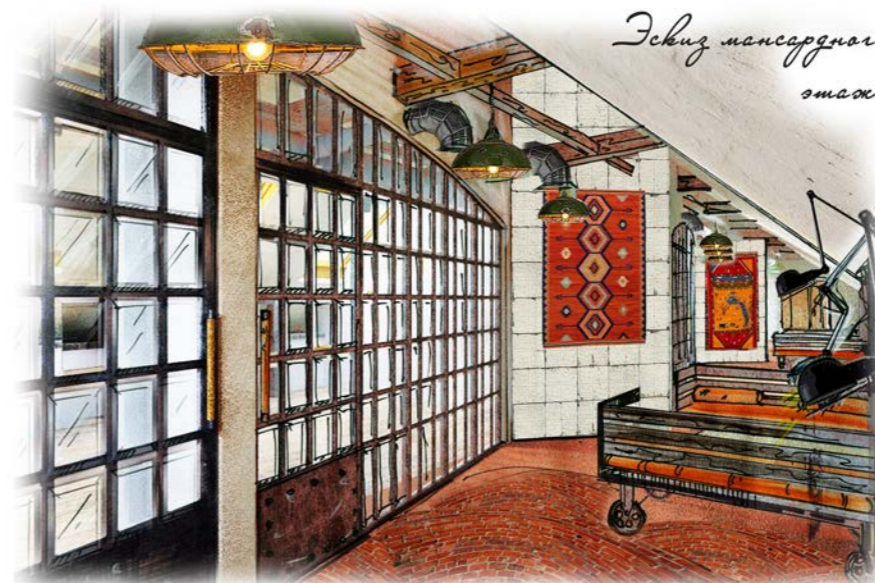
Эскиз мансардного этажа

фасад. Прежде чем подобрать те или иные реставрационные материалы, необходимо было провести исследование состояния фасада и кладочного раствора, понять характер повреждений и учесть массу особенностей здания.