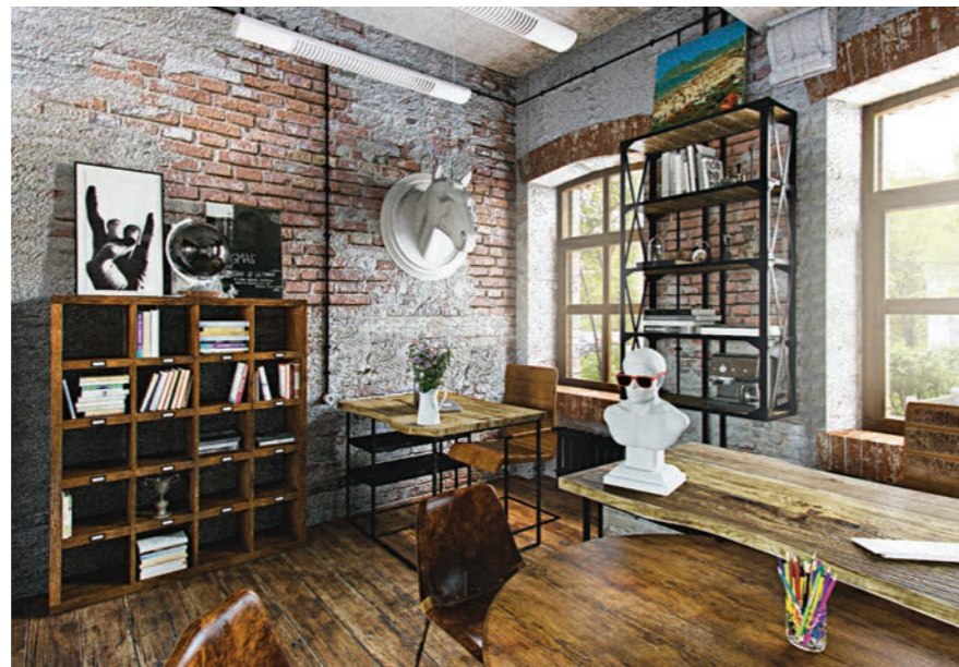
Продолжение. Начало на стр. 1

Все эти неслучайные элементы стали основой для логотипа.